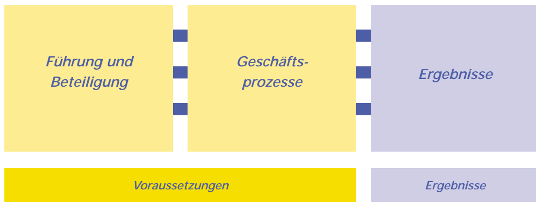
Abb. 2: Kriterien guter Praxis für BGF in KMU

Die Kriterien lassen sich in drei Bereiche unterteilen (vgl. Abb. 2). Zu den Voraussetzungen gesundheitsfördernder KMU zählen die Integration von Gesundheitsfragen in die alltägliche Führungspraxis sowie in die Geschäftsprozesse. Auch für die daraus folgenden Ergebnisse wurden Kriterien formuliert.