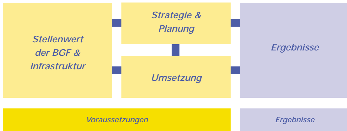
Abb. 3: Kriterien guter Praxis für die überbetriebliche Ebene

Die Kriterien für die überbetriebliche Ebene sind in vier Bereiche unterteilt, von denen drei die Voraussetzungen für eine gesundheitsfördernde überbetriebliche Unterstützungsstruktur bilden. Der Vierte bezieht sich auf die Projektergebnisse (s. Abb. 3).