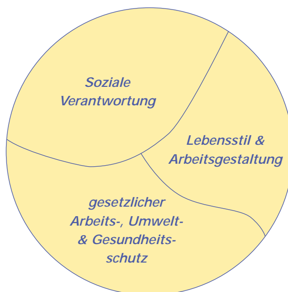
Abb. 1: Handlungsfelder der BGF in KMU

Vorbildliche Praxis zeichnet sich dadurch aus, dass nicht nur die gesetzlichen Anforderungen erfüllt werden, sondern darüber hinaus zusätzlich Maßnahmen in den beiden anderen Handlungsfeldern durchgeführt werden.